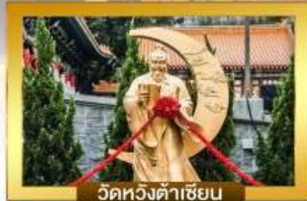
วัดหวังต้าเซียน