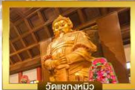
วัดแซงหมิว