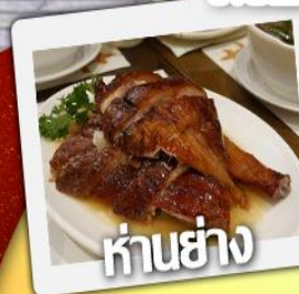
ค่านย่าง