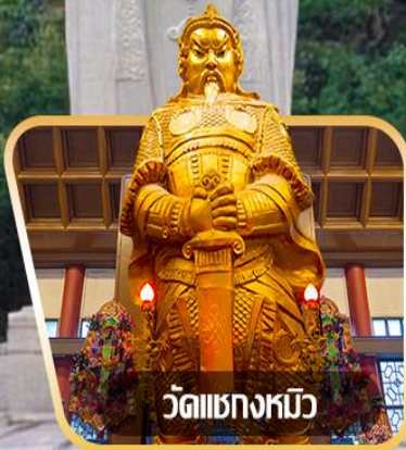
วัดเขangkงหิว