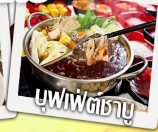
บุฟฟัตชาบู