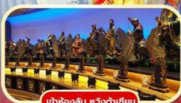
เข้าห้องลับ หวังต้าเซียน

พิเศษ | ✓ เข้าห้องลับ หวังต้าเซียน ✓ ล่องเรือข้ามเกาะเพ่งเจ้า