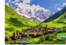
หมู่บ้าน Ushguli

** พักที่ Best Western Hotel หรือเทียบเท่า **