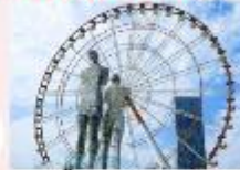
รูปปั้นอาลีและนีโน