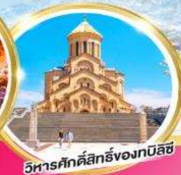
วิหารศักดิ์สิทธิ์ของทบิลีซี