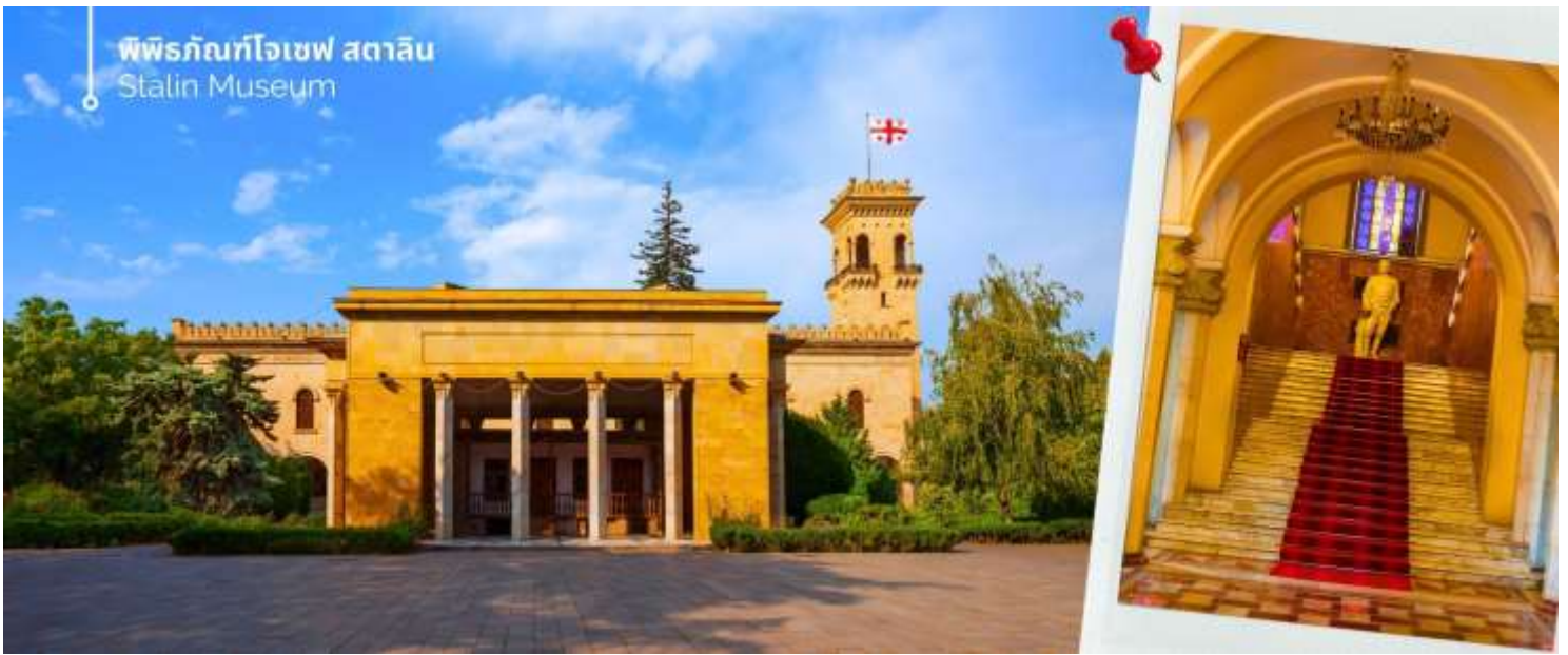
พิพิธภัณฑ์โจเซฟ สตาลิน Stalin Museum

ออกเดินทางต่อไปยังเมืองกอรี (ใช้เวลาเดินทางประมาณ 1 ชั่วโมง 20 นาที) นำท่านเที่ยวชม พิพิธภัณฑ์โจเซฟ สตาลิน (Stalin Museum) ซึ่งที่เมืองนี้เป็นบ้านเกิดของโจเซฟ สตาลิน อดีตผู้นำสูงสุดของสหภาพโซเวียต สตาลินถูกยกย่องเป็นวีรบุรุษที่นำพาสหภาพโซเวียตให้รุ่งเรือง แต่ในขณะเดียวกันก็เป็นที่รู้จักในด้านการกดขี่ข่มเหงและการฆ่าล้างเผ่าพันธุ์ พิพิธภัณฑ์แห่งนี้จึงเป็นแหล่งเรียนรู้เกี่ยวกับชีวิตและผลงานของสตาลิน รวมถึงผลกระทบที่เขามีต่อ