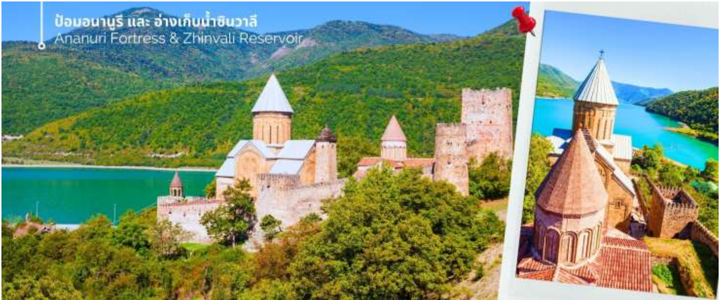
ป้อมอนานูรี และ อ่างเก็บน้ำชินวาลี Ananuri Fortress & Zhinvali Reservoir

ออกเดินทางต่อไปยังเมืองกอรี (ใช้เวลาเดินทางประมาณ 1 ชั่วโมง 20 นาที) นำท่านเที่ยวชม พิพิธภัณฑ์โจเซฟ สตาลิน (Stalin Museum) ซึ่งที่เมืองนี้เป็นบ้านเกิดของโจเซฟ สตาลิน อดีตผู้นำสูงสุดของสหภาพโซเวียต สตาลินถูกยกย่องเป็นวีรบุรุษที่นำพาสหภาพโซเวียตให้รุ่งเรือง แต่ในขณะเดียวกันก็เป็นที่รู้จักในด้านการกดขี่ข่มเหงและการฆ่าล้างเผ่าพันธุ์ พิพิธภัณฑ์แห่งนี้จึงเป็นแหล่งเรียนรู้เกี่ยวกับชีวิตและผลงานของสตาลิน รวมถึงผลกระทบที่เขามีต่อ