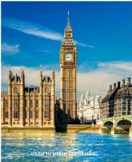
บรรยากาศระหว่างส่องเรือ

จากนั้นนำท่านผ่านชม พระราชวังบักกิงแฮม ก่อนนำท่านเก็บภาพสวยๆที่ หอนาฬิกาบิกเบน สัญลักษณ์ที่สำคัญของลอนดอนที่ตั้งอยู่เคียงข้างอาคารรัฐสภาที่สวยงามริมฝั่งแม่น้ำเทมส์ จากนั้นผ่านชมสถานที่สำคัญต่างๆ อาทิ บ้านเลขที่ 10, ถนนดาวนนิ่งทำเนียบนายกรัฐมนตรี, จัตุรัสทราฟัลการ์, อนุสรณ์แห่งสงครามทราฟัลการ์ของท่านลอร์ดแนลสัน, พิคคาเดิลลี เซอร์คัส, ย่านโซโฮ ฯลฯ