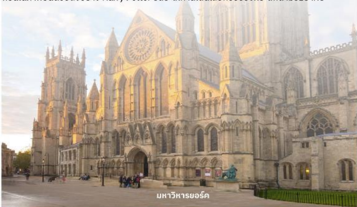
มหาวิหารยอร์ก

จากนั้นนำท่านเดินทางต่อไปที่ The Shambles (เดอะแซมเบิล) เป็นสถานที่ที่มีความคล้ายกับตรอกไดอากอนในภาพยนตร์ชื่อดังอย่าง Harry Potter อีสระให้ท่านเดินเลือกซื้อของที่ระลึกตามอัธยาศัย