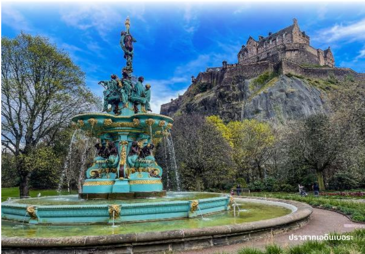
ปราสาทเอดินเบอระ

ผู้ตรงข้ามเป็นรัฐสภาแห่งชาติสกอตอันน่าทึ่งด้วยสถาปัตยกรรมร่วมสมัย