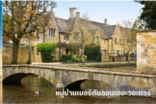
หมู่บ้านเบอร์ตันออนเดอะวอเทอร์