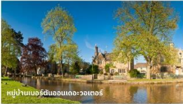
หมู่บ้านเบอร์ตันออนเดอะวอเทอร์