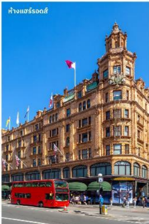
ห้างแฮร์รอดส์