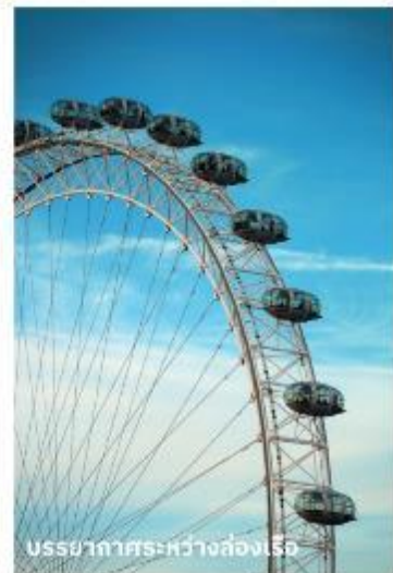
บรรยากาศระหว่างส่องเรือ

ท่านสามารถทำการสแกน QR CODE นี้ เพื่อรับชม “บรรยากาศของ Big Ben” ในรูปแบบวีดีโอ