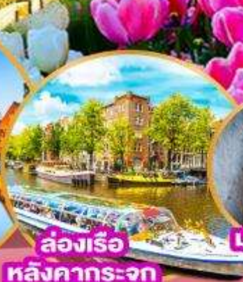
ล่องเรือ หลังคากระจุก