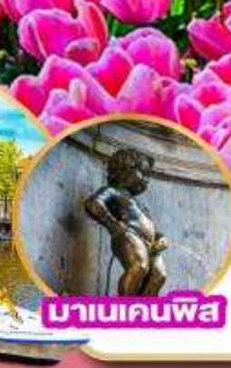
มานเนคพิส