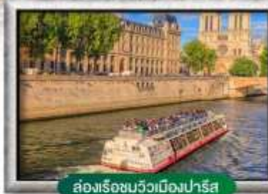
ล่องเรือชมวิวเมืองปารีส