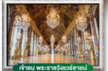
เข้าชม พระราชวังแวร์ซายน์