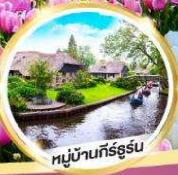
หมู่บ้านกิร์ธูร์น