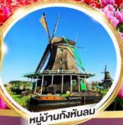
หมู่บ้านกังหันลม