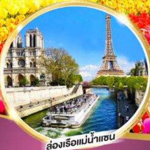
ล่องเรือแม่น้ำแซน