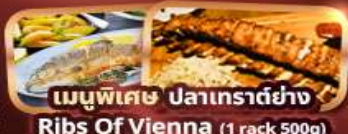
เมนูพิเศษ ปลาเทราต์ย่าง Ribs Of Vienna (1 rack 500g)

การ์นิตี 15 ท่านออกเดินทาง พร้อมหัวหน้าทัวร์คนไทย