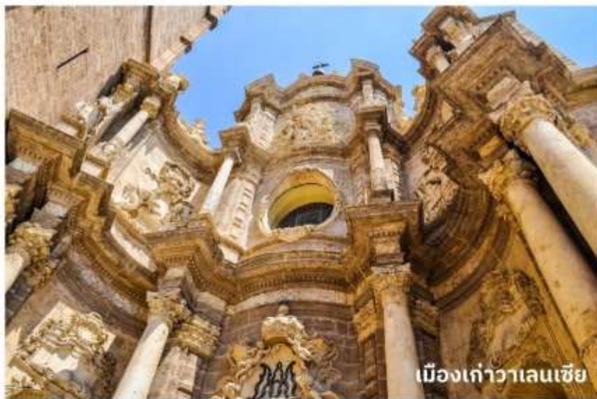
เมืองเก่าวาเลนเซีย