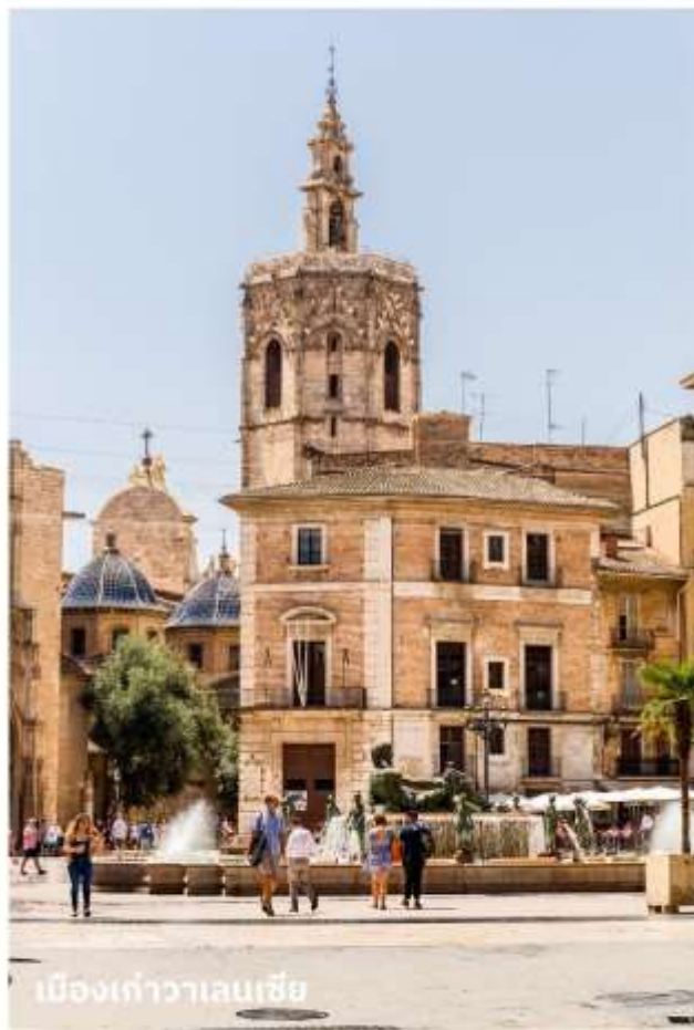
เมืองเก่าวาเลนเซีย