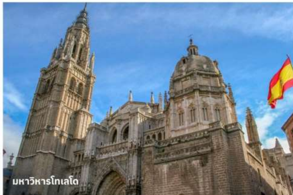
มหาวิหารโทเลโด

จากนั้นนำท่านเดินทางเข้าสู่ ย่านเขตเมืองเก่าโทเลโด นำท่านถ่ายรูปด้านหน้า มหาวิหารโทเลโด (Toledo Cathedral) เป็นมหาวิหารโกธิกที่งดงามที่สุดแห่งหนึ่งในยุโรป และนำท่านถ่ายรูปที่ อัลกาซาร์แห่งโทเลโด (Alcázar of Toledo) ปราสาทที่ตั้งอยู่บนยอดเขาในเมือง เป็นสัญลักษณ์สำคัญของโทเลโด ปัจจุบันเป็นพิพิธภัณฑ์กองทัพ จากนั้นอิสระให้ท่านได้เดินเล่นภายในตัวเมืองเพื่อเลือกซื้อสินค้าที่ระลึกตามอัธยาศัย