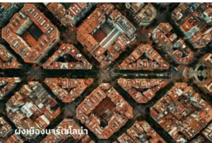
ผังเมืองบาร์เซโลน่า