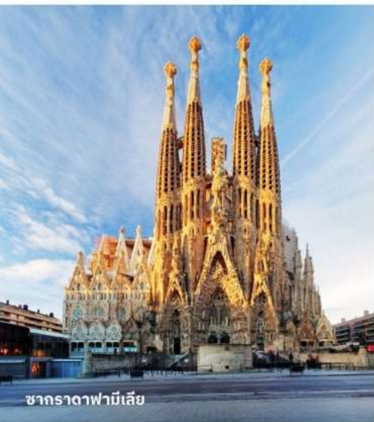
ซากราดาฟามีเลีย