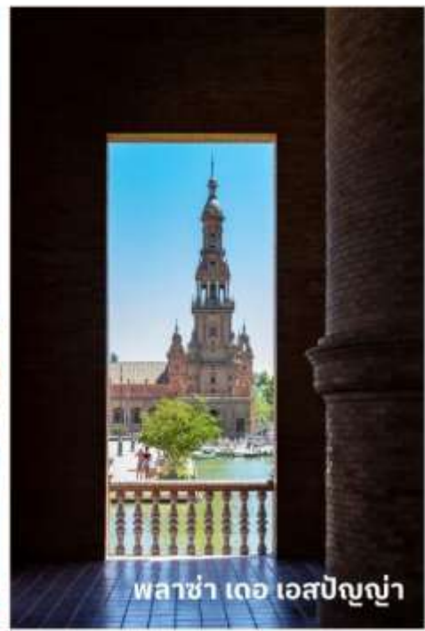
พลาซ่า เดอ เอสปันญ่า

ถึงเวลาอันสมควรนำท่านเดินต่อไปยัง เมืองกรานาดา (Granada) ใช้เวลาเดินทางประมาณ 4 ชั่วโมง เป็นเมืองมรดกโลกในแคว้นอัลดาลูเซีย ที่มีเรื่องราวมากมายผสมผสานวัฒนธรรมระหว่างศาสนาคริสต์และอิสลามเมื่อกว่า 1,000 ปีก่อนหน้านี้ แต่ยังคงทิ้งซึ่งความงดงามและมนต์ขลังไว้อย่างสมบูรณ์