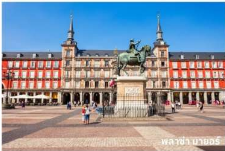
พลาซ่า มายอร์

จากนั้นนำท่านเดินทางสู่ กรุงมาดริด (Madrid) เมืองหลวงของประเทศสเปน ตั้งอยู่ใจกลางแหลมไอบีเรีย ในระดับความสูง 650 เมตร เป็นมหานครอันทันสมัยล้ำยุคที่กษัตริย์ฟิลลิปที่ 2 ได้ทรงย้ายที่ประทับจากเมืองโทเลโดมาที่นี้และประกาศให้มาดริดเป็นเมืองหลวงใหม่ ยกเว้นในช่วงประมาณปี ค.ศ. 1601-1607 เมื่อพระเจ้าฟิลลิปที่ 3 ได้ย้ายเมืองหลวงไปที่เมืองวัลลาโดลิด มาดริดได้ชื่อว่าเป็นเมืองหลวงที่สวยงามที่สุดแห่งหนึ่งในโลกและสูงสุดแห่งหนึ่งในยุโรป จากนั้นผ่านชม น้ำพุไซเบเลส (Cibeles Fountain) ที่สร้างอุทิศให้แก่เทพธิดาไซเบลิน เป็นสถานที่ที่ใช้ในการเฉลิมฉลองในเทศกาลต่างๆของเมือง และนำท่านเดินทางสู่ พลาซ่า มายอร์ (Plaza Mayor) ใกล้เคียง เขตปูเอตาเดลซอล หรือประตูพระอาทิตย์ ซึ่งเป็นจุดสนใจกลางเมือง นับเป็นจุดนัดภักโกลเมตรแรกของสเปน (กิโลเมตรที่ศูนย์) และยังเป็นศูนย์กลางรถไฟใต้ดินและรถเมล์ทุกสาย นอกจากนี้ยังเป็นจุดตัดของถนนสายสำคัญของเมืองที่หนาแน่นด้วยร้านค้าและห้างสรรพสินค้าใหญ่มากมาย