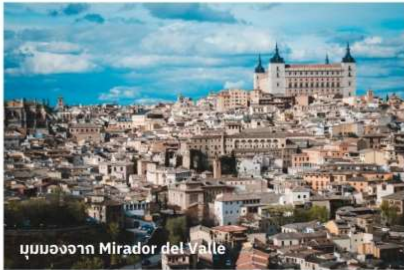
มุมมองจาก Mirador del Valle

จากนั้นเดินทางสู่ เมืองโทเลโด (Toledo) ใช้เวลาเดินทางประมาณ 1 ชั่วโมง อดีตเมืองหลวงเก่าของสเปนตั้งแต่คริสต์ศตวรรษที่ 13 เป็นเมืองแห่งศูนย์กลางประวัติศาสตร์และวัฒนธรรมของสเปน ตั้งอยู่ในแคว้นกัสติยา-ลามันชา ประเทศสเปน โดดเด่นด้วยความหลากหลายทางวัฒนธรรมที่ผสมผสานระหว่างคริสต์ ยิว และมุสลิมจนได้รับการขึ้นทะเบียนเป็นมรดกโลกโดยยูเนสโกในปี 1986