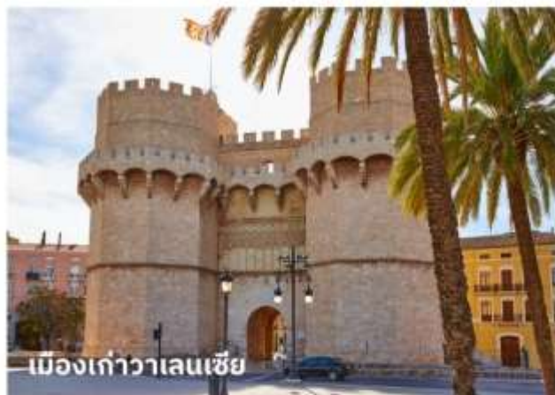
เมืองเก่าวาเลนเซีย

จากนั้นนำท่านเที่ยวชม ย่านใจกลางจัตุรัสเมืองเก่า ซึ่งเป็นที่ตั้งของศาลากลาง, ที่ทำการไปรษณีย์, ร้านค้า, สนามสู่วัวกระทิง นำท่านถ่ายรูปกับ มหาวิหารวาเลนเซีย หรือ มหาวิหารซานตามาเรียแห่งวาเลนเซีย (Catedral de Santa Maria de Valencia) มหาวิหารที่ตั้งอยู่บริเวณใจกลางเมืองเก่า สร้างขึ้นในสไตล์ผสมผสานอาทิ โกรธิค, นีโอคลาสสิก, บาโรค