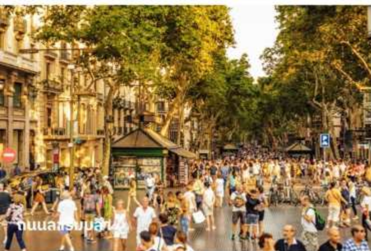
ถนนลารัมบลลา