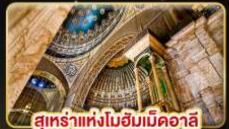
สุเหร่าแห่งโมฮัมเหม็ดอาลี

น้ำหนักกระเป๋า 23Kg. (ปีระหว่างประเทศ และปีนภายใน)