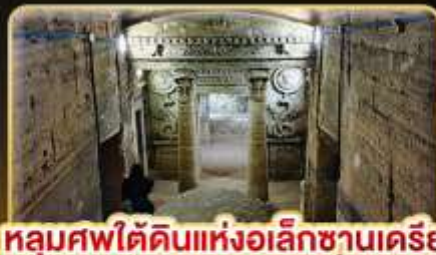
หลุมศพใต้ดินแห่งอเล็กซานเดรีย