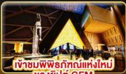
เข้าชมพิพิธภัณฑ์แห่งใหม่ ของยิปต์ GEM

ชม 1 ใน 7 สิ่งมหิศจรรย์ของโลก “มหาพีระมิดแห่งกิซ่า”