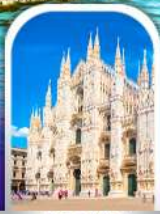
DUOMO MILAN ITALY