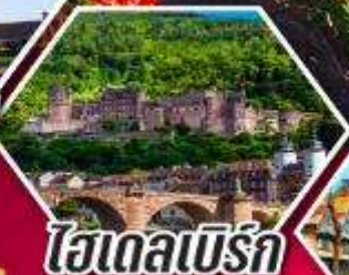
ไฮเดลเบิร์ก