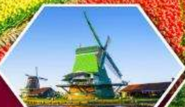
หมู่บ้านกังหันลม ซานส์ตีบส์