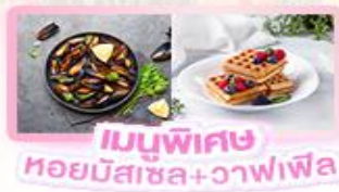
เมนูพิเศษ หอยมัสเซล+วaffle