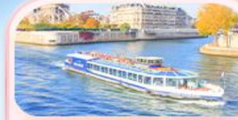
ล่องเรือแม่น้ำแซน