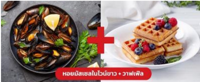
หอยมัสเซลไวน์ขาว + วาฟเฟิล

เย็น 🍷 รับประทานอาหารเย็น (มือที่10) เมนูพิเศษ!! หอยมัสเซล + วาฟเฟิล (Mussel in White wine + Waffle)