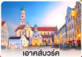
อาคส์บวร์ค