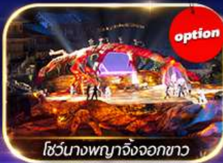
โชว์นางพญาจิ้งจอกขาว