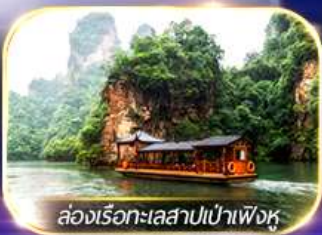
ล่องเรือทะเลสาบเป่าเฟิงหู