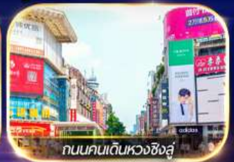
ถนนคนเดินหวงซิงสู

ล่องเรือชมเมืองโบราณ ฟุรงเจิน + ทะเลสาบเป่าเฟิงหู