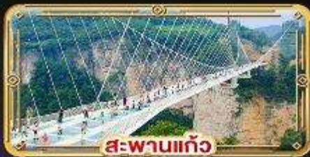
สะพานแก้ว