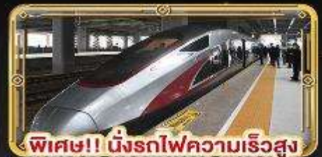
พิเศษ!! นิ่งรถไฟความเร็วสูง