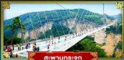
สะพานกระจก

สัมผัสบรรยากาศหมู่บ้านโบราณ ชมหุบเขาอวตาร