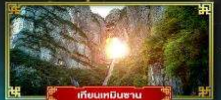
เทียนหมินซาน