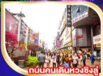
ถนนคนเดินหวงชิ่งลู่