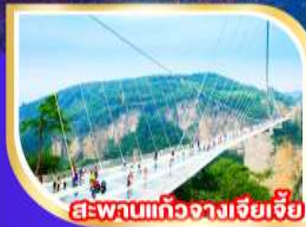
สะพานแก้วจากเจียเจีย