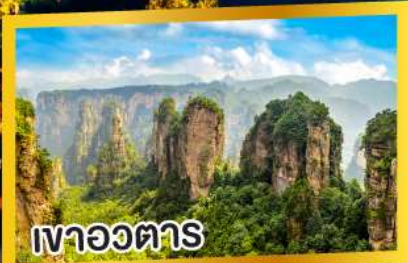
เวาอวดตาร์