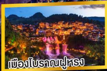
เมืองโบราณฟูหรง