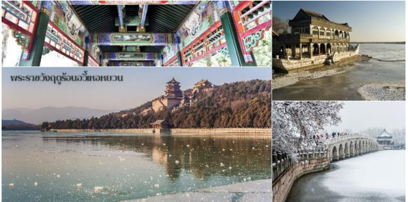
พระราชวังฤดูร้อนอ้วเหอหยวน