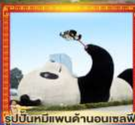
รูปปั้นหมีแพนด้าอนเชลฟ์