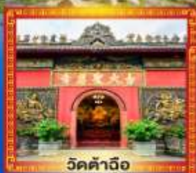
วัดคำฉือ