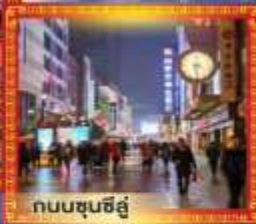
ถนนชุนชิว