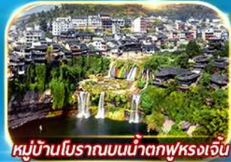
หมู่บ้านโบราณบนน้ำตกฟุรงเจิน