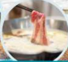
เมนูพิเศษ สุกี่หม่าล่า