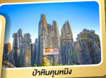
ป่าหินคุณหมิง