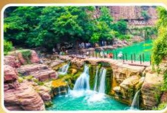
อุทยานหยุ่นโกซาน