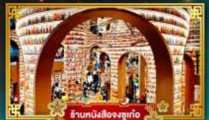
ร้านหนังสือจูกงเก้อ