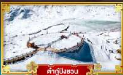
คำกู่ปิงชวณ

สัมผัสความหนาว เที่ยวจัดเต็ม “4 อุทยานสวรรค์”