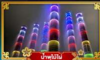
น้ำพุไมโม่