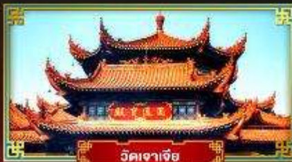
วัดเจาเจีย