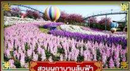
สวนผักบานสีฟ้า