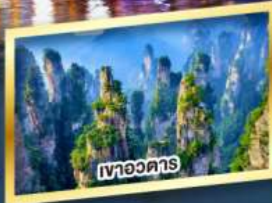
เขาอวตาร