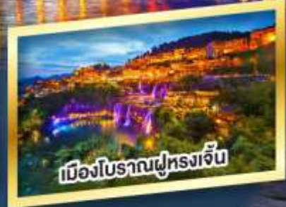
เมืองโบราณฝูหลงเจิ้น