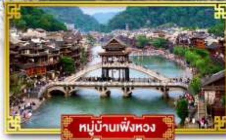
หมู่บ้านเฟิ่งหวง