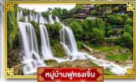
หมู่บ้านฟุ่หลงเจิ้น