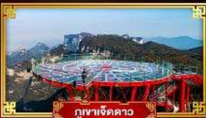
กุเขาเจ็ดดาว