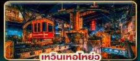
เทวินเทอโฮ่ย