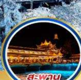
สะพาน หนานเฉียว