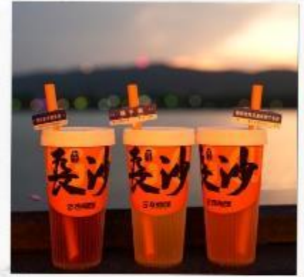
เซียงเจียงริเวอร์ไซด์