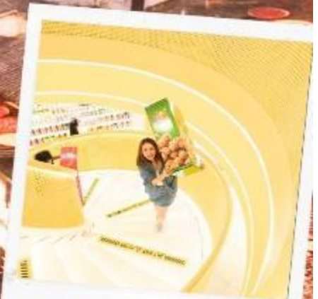
SNACK BUSY STATION