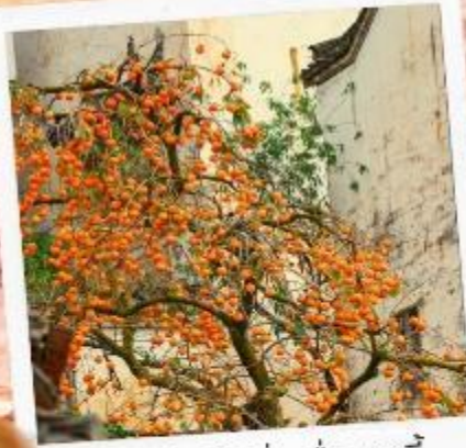
柿柿如意 ชื่อ ชื่อ หยูอี้ ลูกพลับแห่งความราบรื่น