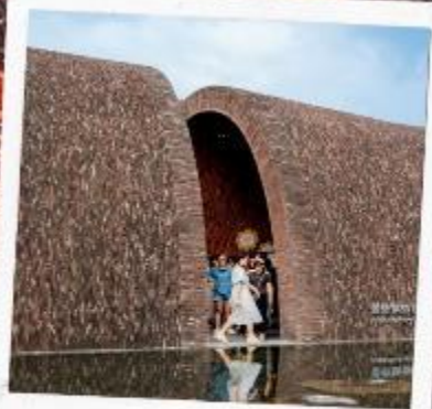
จิ้งเต๋อเจิ้น