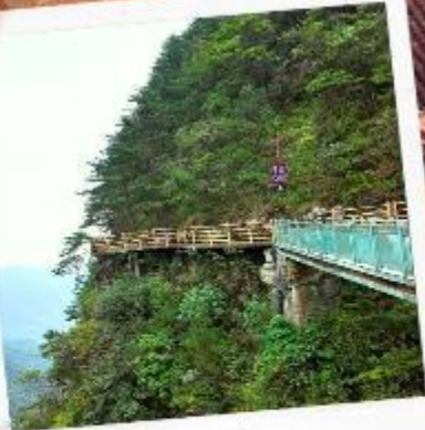
หมิงเยวี่ยซาน