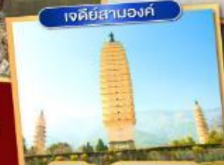
เจดีย์สาบองค์