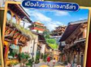
เมืองโบราณชางกรี่ล่า