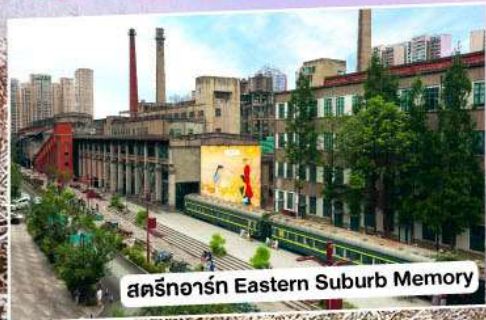
สตรีทอาร์ต Eastern Suburb Memory