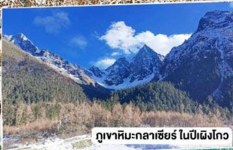
ภูเขาหิมะกลางเข็ญ ในปีเฉิงโกว