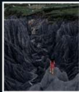
สวนหินปาเหมย์