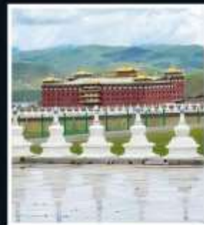
วัดต้ากวง