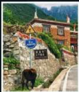
หมู่บ้านทิเบต