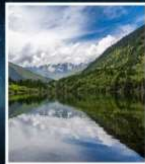
อุทยานมู่เก้อจิว