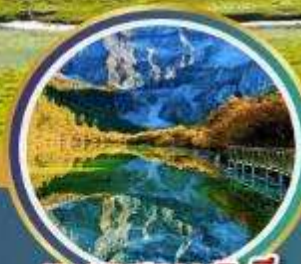
ทะเลสาบ 5 สี