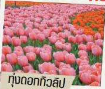
ทุ่งดอกทิวลิป