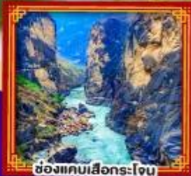
ช่องแคบเสื่อกรโง