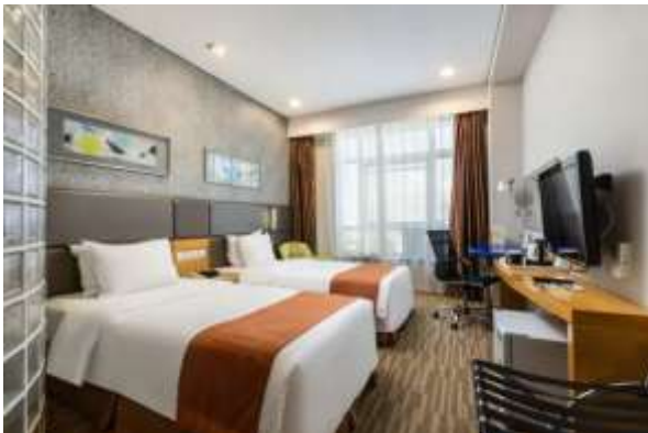
Holiday Inn Express Hotel