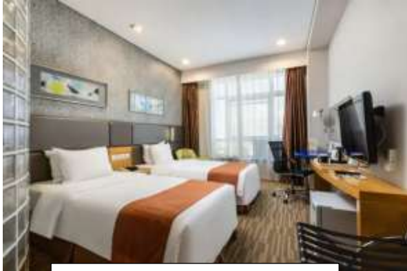
Holiday Inn Express Hotel

ที่พัก Holiday Inn Express Hotel หรือ Jinglin Hotel หรือ เทียบเท่า 4 ดาว