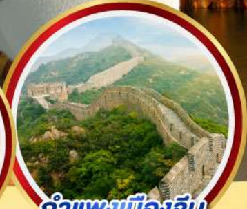
กำแพงเมืองจีน ด่านจวิ๊ยกทวน