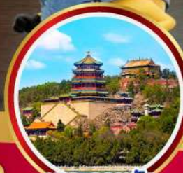
พระราชวัง ฤดูร้อน