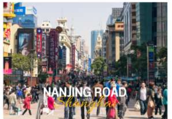
NANJING ROAD Shanghai

ถนนหนานจิง หรือที่รู้จักกันอีกชื่อว่า นานกิง ย่านช้อปปิ้งที่เก่าแก่และมีชื่อเสียงที่สุดในเซี่ยงไฮ้เลยในตอนเย็นจะเป็นช่วงที่ร้านค้าและบาร์ต่างๆกำลังคึกคักมีนักดนตรีริมถนนเต็มไปด้วยแสงสีเสียงเหมาะกับการเดินเล่นหรือนั่งรถรางชมบรรยากาศรอบๆฝั่งตะวันตกจะมีห้างสรรพสินค้าใหญ่ๆสลับกับร้านแบบจีนดั้งเดิมอยู่ตลอดสองข้างทาง