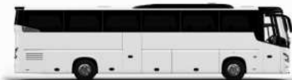
ตัวอย่างรถพลาทอน 1 ชั้น

ค่าที่พักตามที่ระบุในรายการหรือเทียบเท่าระดับเดียวกัน (พิกห้องละ 2 ท่าน) หากประเภทห้องที่ท่านริเสวนาเดิม อาทิ เช่น ริเสวนาห้องพักเป็น TWIN BED หรือ DOUBLE BED ทางบริษัทขอสงวนสิทธิ์ในการปรับประเภทห้องพัก เป็นตามที่โรงแรมมีอยู่ โดยไม่ต้องแจ้งให้ทราบล่วงหน้า