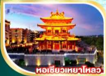
หอชิวเหยาไหล