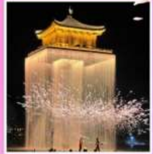
อุ๊นวีโจว