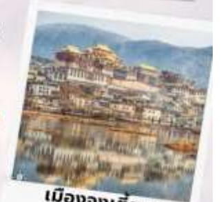
เมืองจางเตียน แซงกรี้ล่า