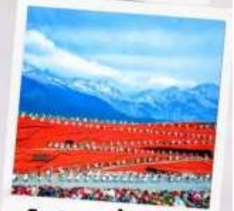
โชว์ จางอีโหมว