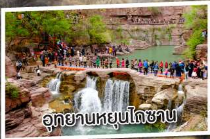
อุทยานหยุ่นโกซาน