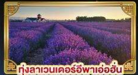
ทุ่งลาเวนเดอร์อิฟาอ้อฮั่น