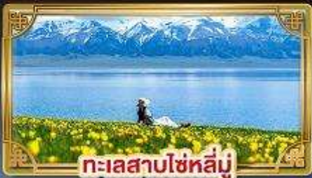
ทะเลสาบไซหลี่มู่