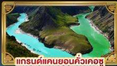
แกรนด์แคนยอนคิ้วเคอซู